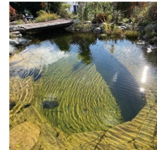
Badeteich: sauberes und klares Wasser.