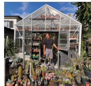
Treibhaus: Experimente mit Kakteen.

Nebst den Kakteen gibt es auch Tessinerpalmen. «Man darf durchaus auch